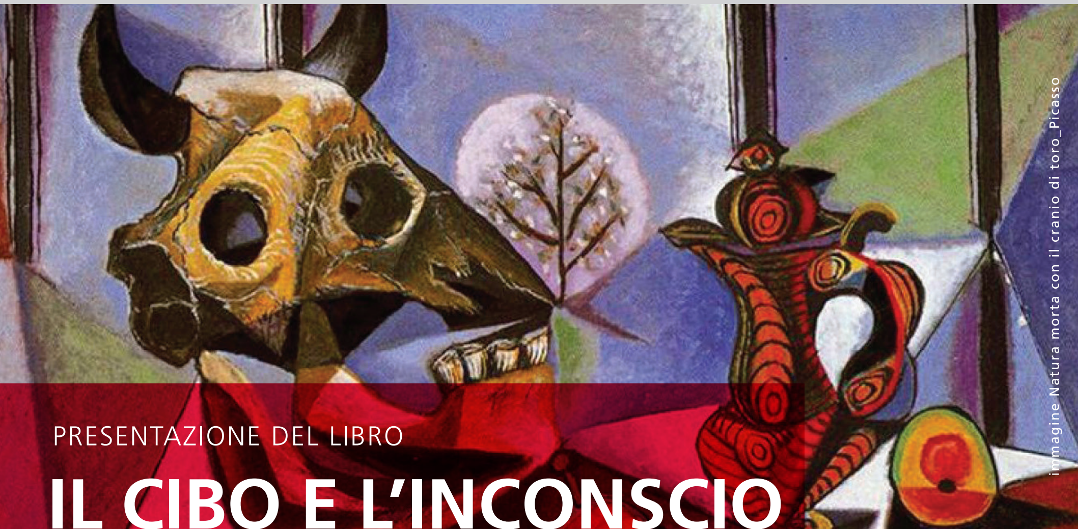
immagine Natura morta con il cranio di toro_Picasso